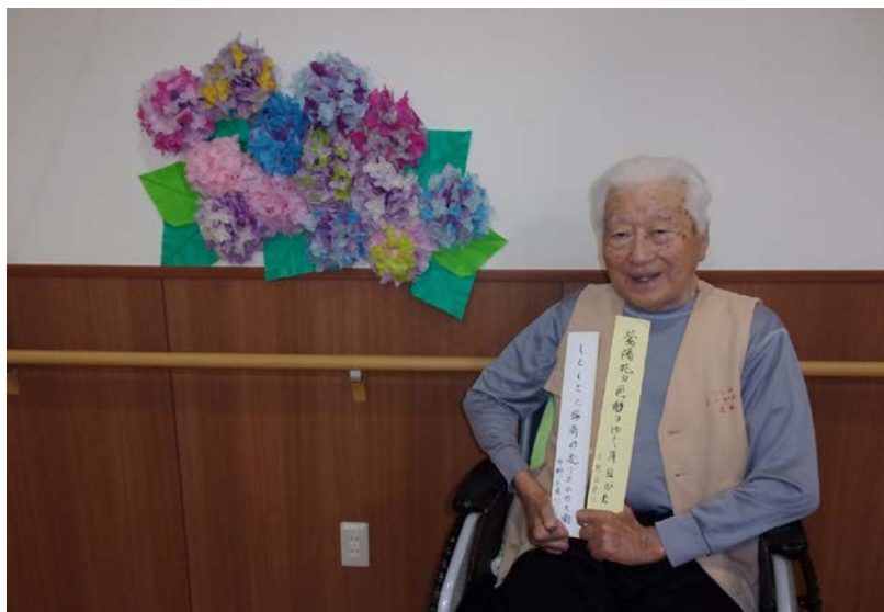
装飾入替と俳句披露